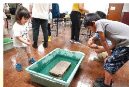
ザリガニをつかまえよう