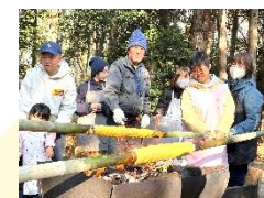
ハウムクーヘンを作ろう