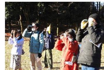
野鳥(とり)と森の自然散策