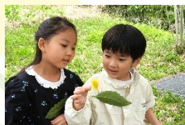
春の草花であそぼう