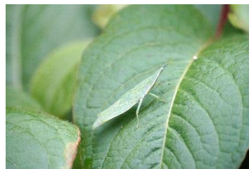
初夏の虫をさがそう