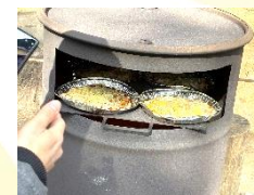
まきでピザを焼こう