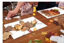
はっぱアートを作ろう