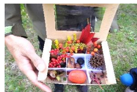
秋のつめあわせを作ろう