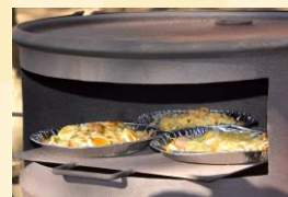
まきでピザを焼こう