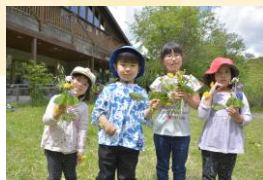
春の草花であそぼう