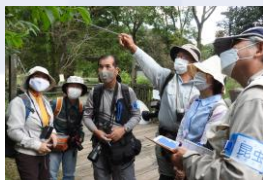
大人の昆虫観察会