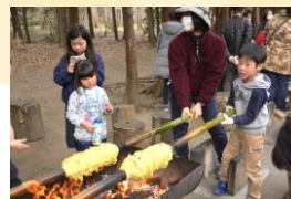
パウムクーヘンを作ろう