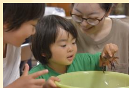
ザリガニをつかまえよう