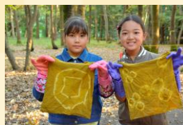
草木染め 外来植物で染めよう