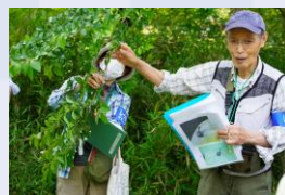
樹木ウォッチング