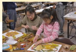
葉っぱアートを作ろう