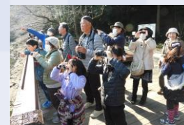
野鳥と森の自然散策