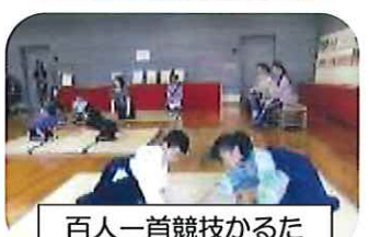
百人一首競技かるた