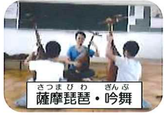
さつまびわ ぎんぶ 薩摩琵琶・吟舞