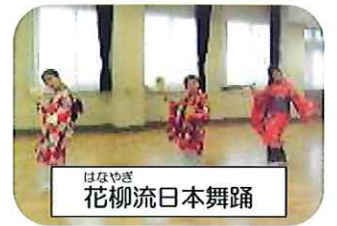
はなやぎ 花柳流日本舞踊