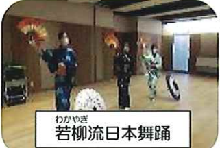
わかやぎ 若柳流日本舞踊