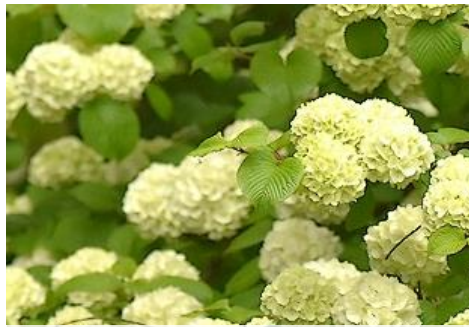
オオデマリ (しらかしの池西側 4～5月)