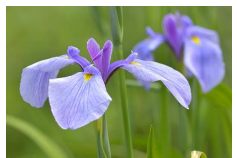
ハナショウブ (ショウブ田 5～6月)