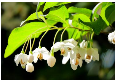
エゴノキ (中池 5月)