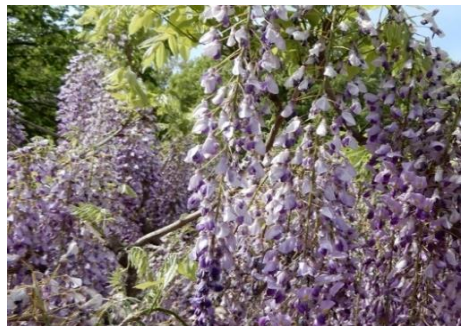
フジ (郷土民家園 4～5月)