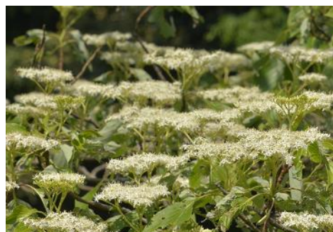
ミズキ (中池 5月)