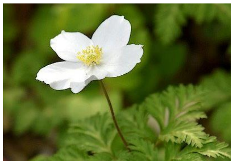
イチリンソウ (山野草園 4月)