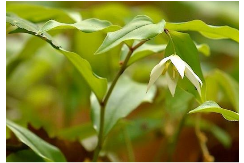
千ゴユリ (山野草園 4月)