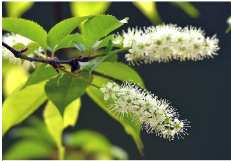
ウワミズザクラ (センター前庭 4月)