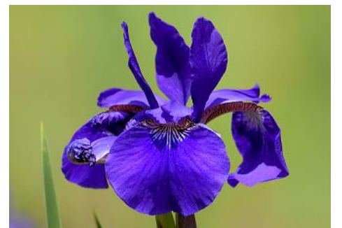
アヤメ (ショウブ田 5月)