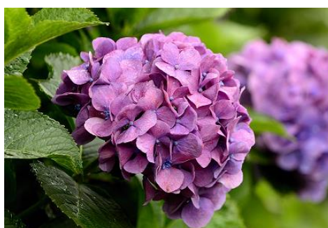
アジサイ (しらかしの池西側 5～6月)