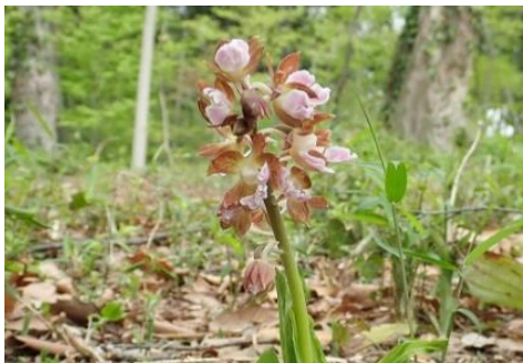
エビネ (山野草園 4月)