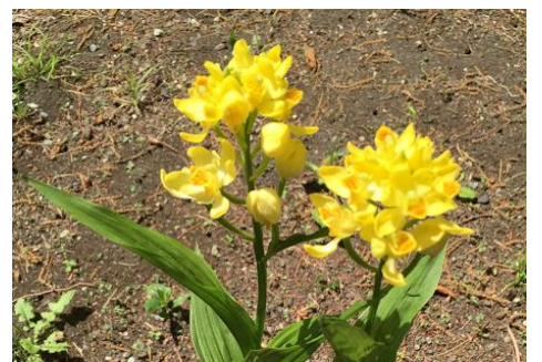
キンラン (キャンプ場 4～5月)