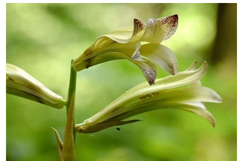
ウバユリ（森のはらっぱ 8月）