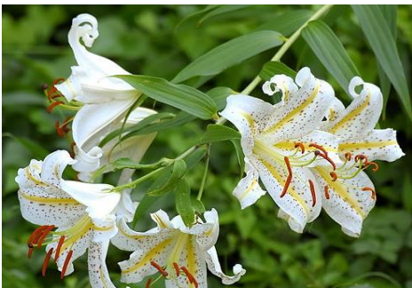
ヤマユリ（くぬぎの森 7～8月）