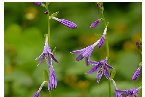
コバギボウシ（まむし池 7～8月）