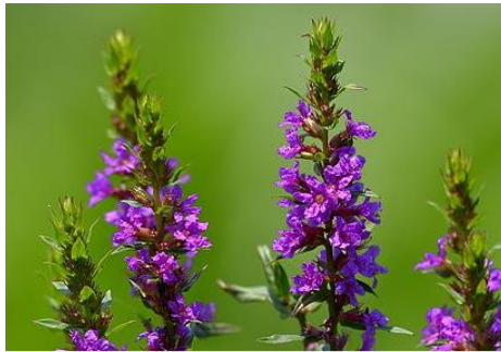
ミソハギ（湿生植物園 7～9月）