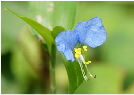
ツククサ（湿生植物園 6～7月）