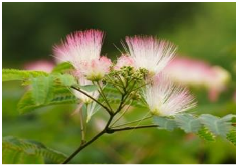
ネムノキ（センター前庭 6～7月）