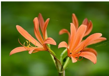
キツネノカミソリ（山野草園 7～8月）