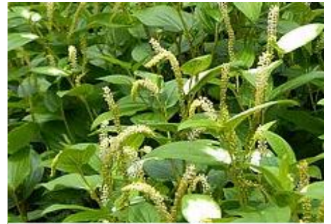
ハンゲショウ（湿生植物園 6～7月）