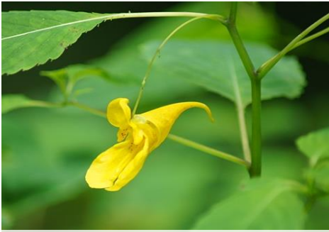
キツリフネ（野外教室広場 5～9月）