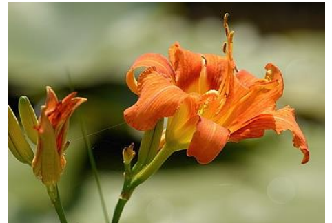
ヤバカンゾウ（ハッ橋デッキ 7月）