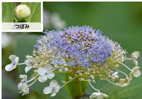
タマアジサイ（水車小屋広場 7～8月）