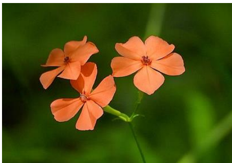
フシグロセンノウ（山野草園 7～8月）