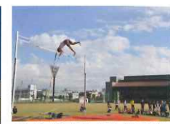
オリンピック種目を楽しく見て、体験する教室