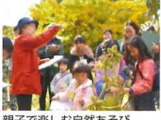
親子で楽しむ自然あそび