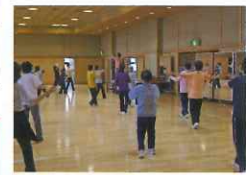
エアロビクス (午後)