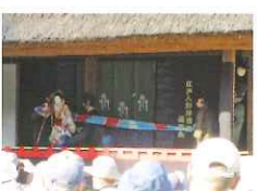
人形浄瑠璃の上演