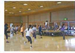
エアロビクス (午前)