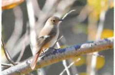
野鳥(とり)と森の自然散策