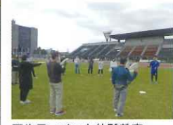
アルティメット体験教室