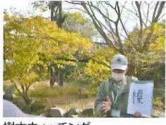
樹木ウォッチング