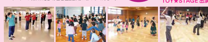
▲身体調整体操(10:30~) ▲幼児スポーツ(11:45~) ▲フラダンス(13:30~) ▲ベリーグダンス(11:50~)