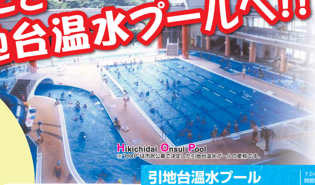
Hikichidai Onsu Pool ※「HOP」は市民公募で決定した引地台温水プールのお名前です。

引地台温水プール 〒242-0022 大和市柳橋4-5000 Tel. 046-260-5757 開館時間 10:00~20:00 (月曜日休館)