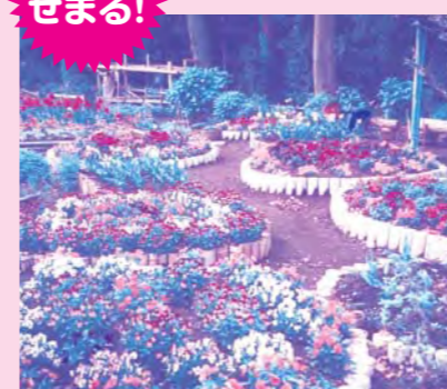
第14回入賞作品 金賞/明るい街づくりの会