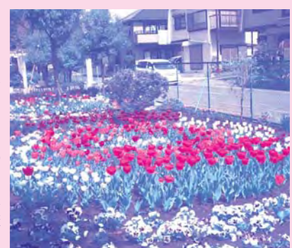
第14回入賞作品 特別賞/花みずき会

応募締切 平成21年8月30日(日) <必着> 応募方法 応募用紙に花壇の写真(全体の雰囲気わかるもの)を2~3枚添えて郵送または直接窓口にて応募してください。 ※応募用紙は財団施設、市関連施設にあります。また財団のホームページからもダウンロードできます。 応募規定 ①応募作品は大和市内で平成20年9月~平成21年8月の花壇を撮影された未発表の自作品に限ります。 ②花壇がきれいになる時期と花壇の所在地、連絡先(他薦であれば推薦者の氏名と連絡先)を連絡いただければ、現地調査に伺います。 ※応募写真は返却いたしません。