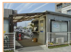
緑の案内所（駐輪場）