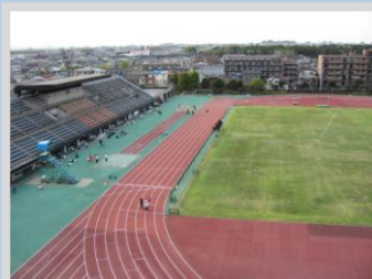
大和スポーツセンター