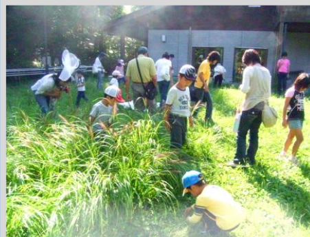
自然とあそぼう／泉の森、ほか