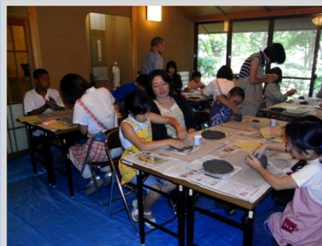
陶芸教室／多胡記念公園（慈緑庵）