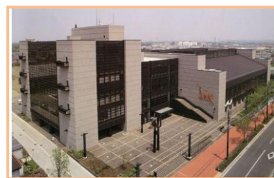
大和スポーツセンター