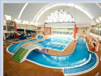
引地台温水プール