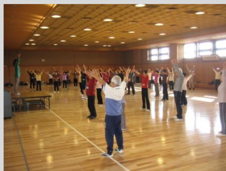
健康はつらつ教室／大和スポーツセンター